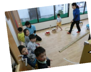
音楽サーキット できるかな…？