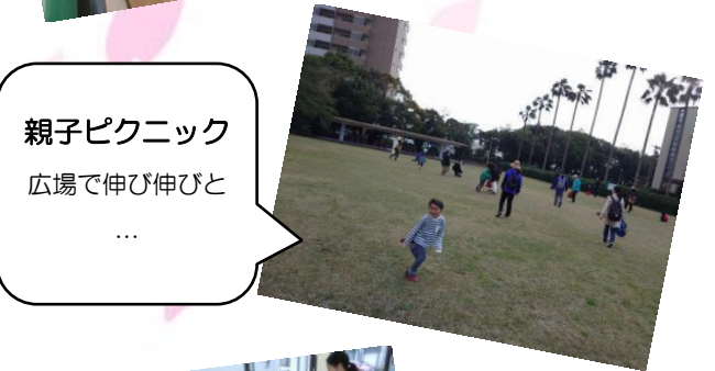
親子ピクニック 広場で伸び伸びと …